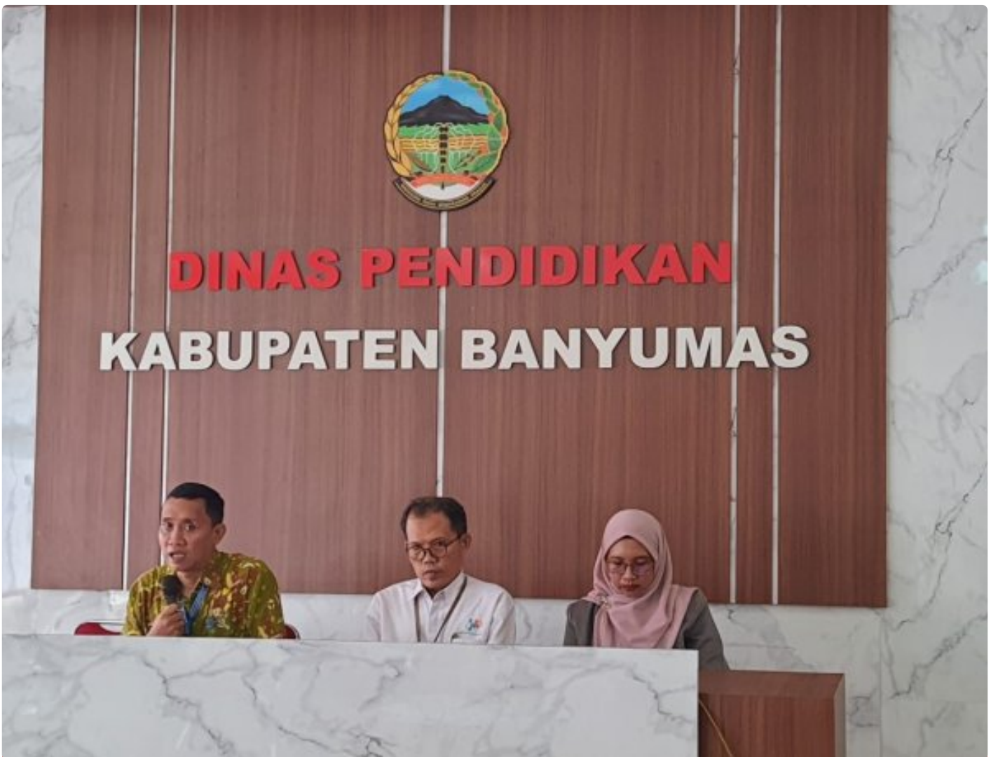
Wujudkan Data Akurat dan Terpadu, Lapas Purwokerto Hadiri FGD Satu Data Banyumas

Purwokerto — Lembaga Pemasyarakatan (Lapas) Kelas IIA Purwokerto menghadiri kegiatan Focus Group Discussion (FGD) Publikasi dalam rangka Satu Data Kabupaten Banyumas Tahun 2026 yang diselenggarakan oleh Pemerintah Kabupaten Banyumas melalui Sekretariat Daerah bekerja sama dengan Badan Pusat Statistik (BPS) Kabupaten Banyumas, Selasa (10/02/2026).