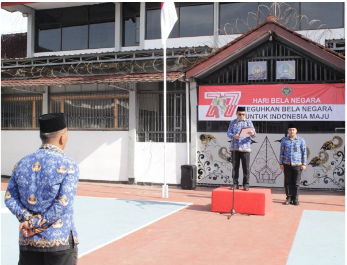
Wujud Nyata Pengabdian, Lapas Narkotika Purwokerto Gelar Upacara Peringatan Hari Bela Negara Ke-77

Purwokerto - Lembaga Pemasyarakatan (Lapas) Narkotika Kelas IIB Purwokerto menggelar Upacara Peringatan Hari Bela Negara ke-77 tahun 2025 dengan mengusung tema "Teguhkan Bela Negara Untuk Indonesia Maju", Jumat (19/12/2025).