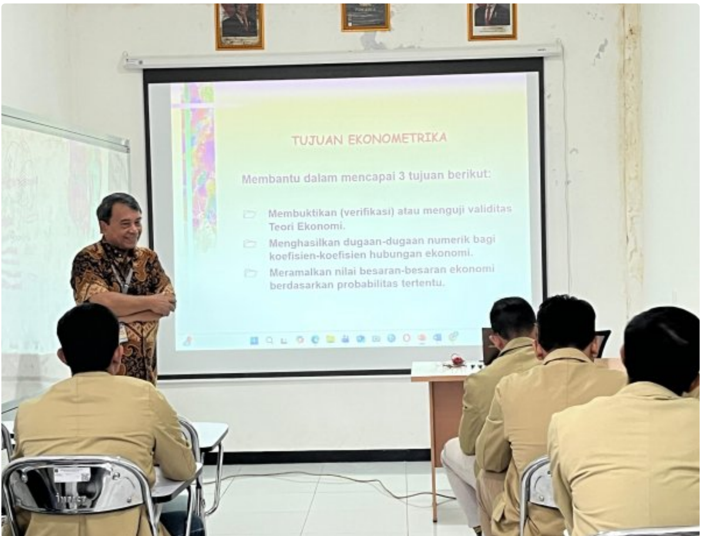
Warga Binaan Lapas Kelas IIA Purwokerto Ikuti Perkuliahan Bersama Dosen UNPERBA

Purwokerto — Lembaga Pemasyarakatan (Lapas) Kelas IIA Purwokerto terus mengoptimalkan program pembinaan di bidang pendidikan melalui kegiatan perkuliahan yang dilaksanakan di Kampus Pembangunan dalam lingkungan lapas.