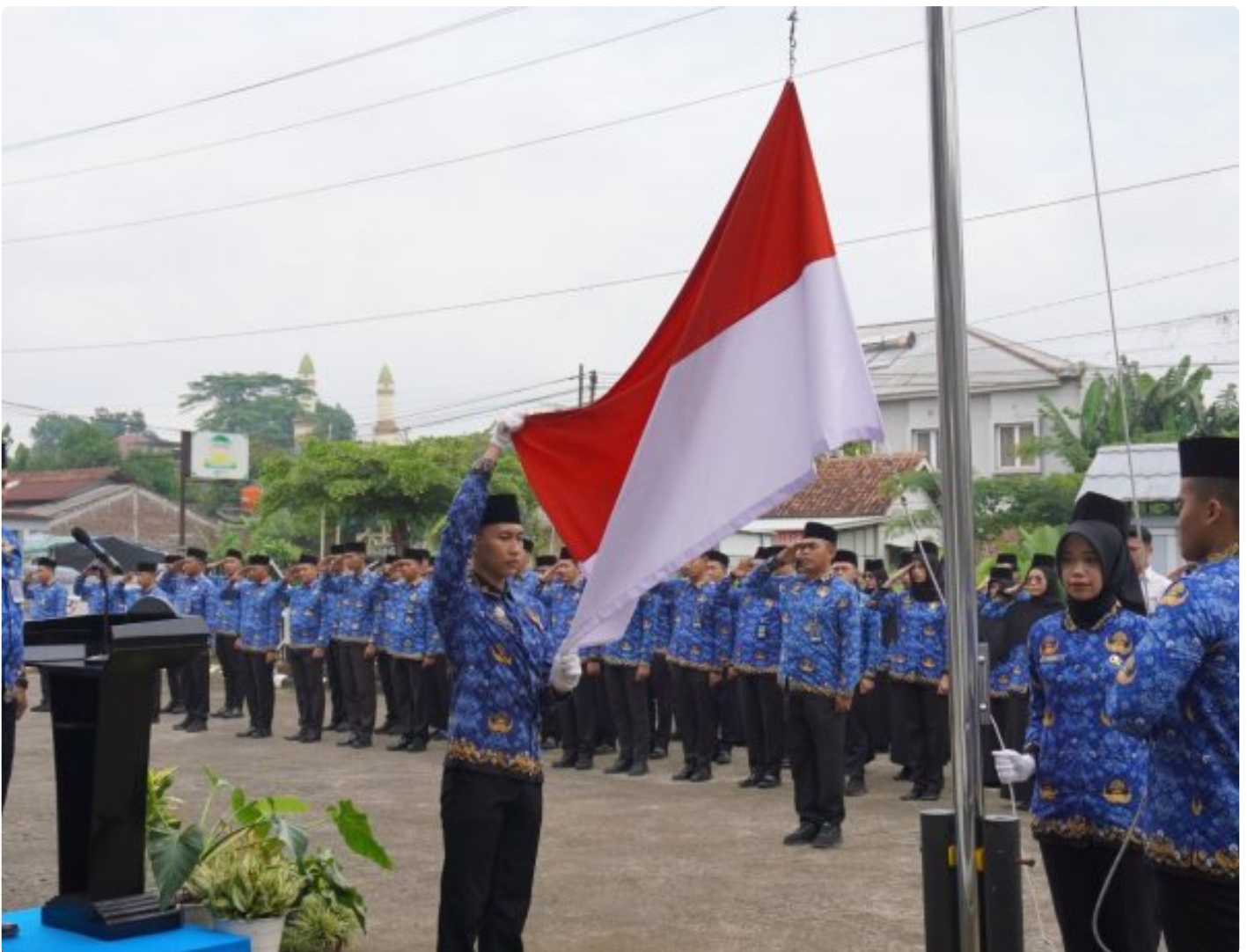
Teguhkan Semangat Pengabdian, Lapas Purwokerto Gelar Upacara Bendera Peringatan HUT KORPRI ke-54 Tahun

Purwokerto - Dalam rangka menyambut Hari Ulang Tahun Korps Pegawai Republik Indonesia (KORPRI) ke-54 Tahun 2025, Lapas Kelas IIA Purwokerto melaksanakan upacara bendera yang berlangsung dengan khidmat di halaman