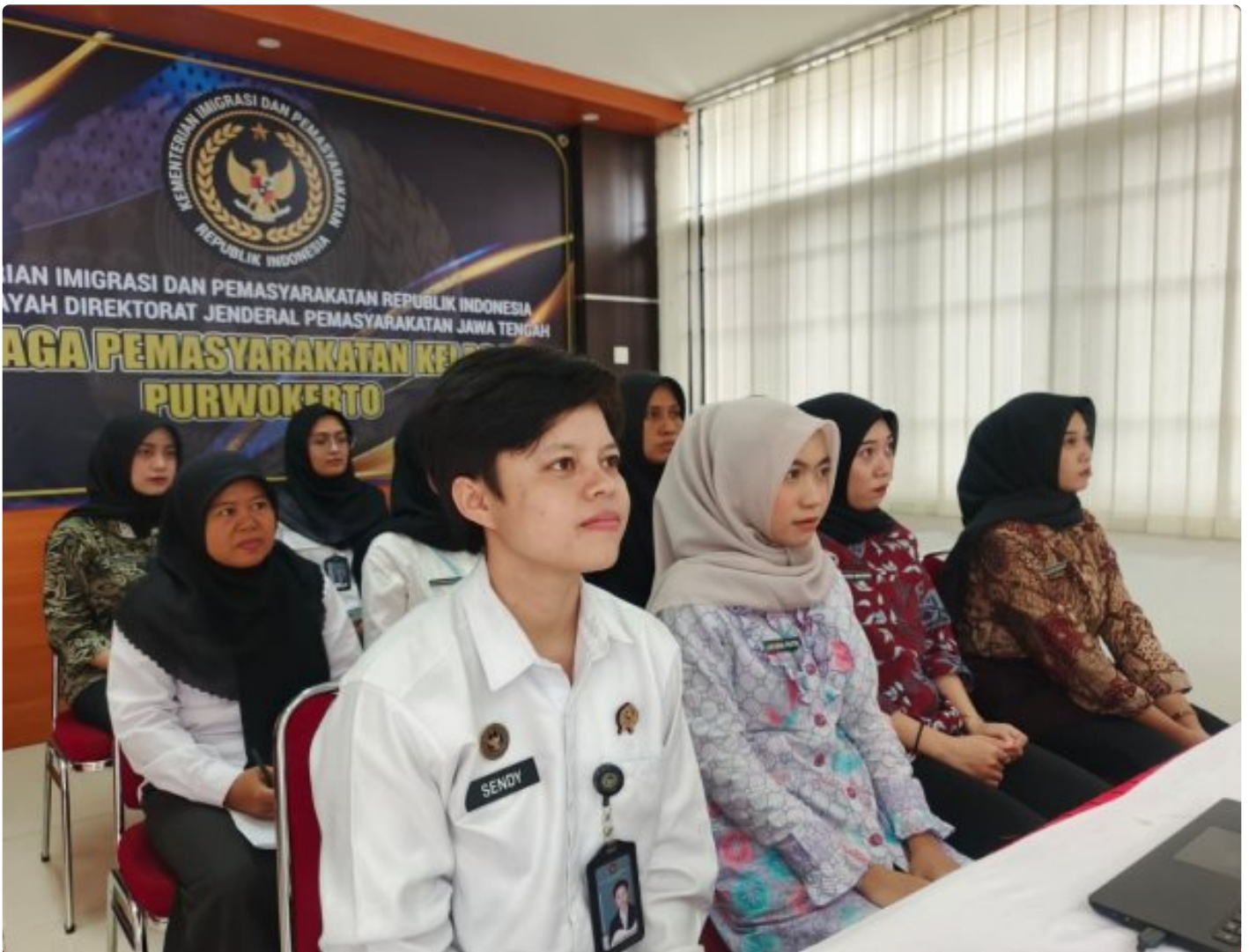
Sosialisasi Pelaksanaan Vaksinasi HPV bagi Pegawai di Kementerian Hukum, HAM, dan Imigrasi Pemasyarakatan melalui Zoom Meeting