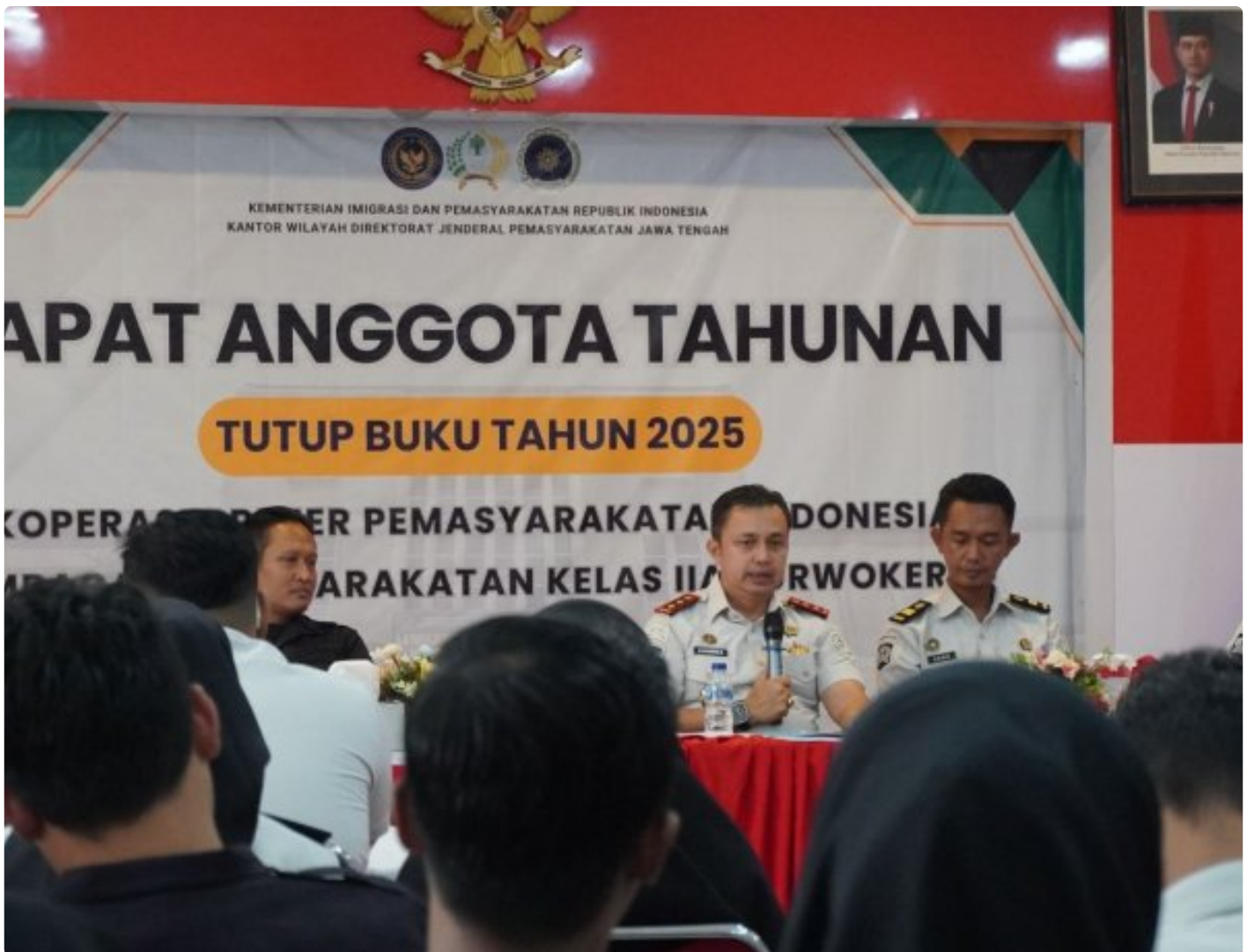
RAT 2025 Primkopasindo, Revolusi Baru untuk Tata Kelola PRIMA

PURWOKERTO - Rapat Anggota Tahunan (RAT) Tahun Buku 2025 Primkopasindo digelar tertib di aula Lapas Kelas IIA Purwokerto sebagai forum evaluasi kinerja koperasi. Pengurus memaparkan laporan pertanggungjawaban, perkembangan usaha, serta kondisi keuangan kepada seluruh anggota. RAT menjadi wujud akuntabilitas dan keterbukaan pengelolaan Primkopasindo di lingkungan lapas, Rabu (07/01/2026).