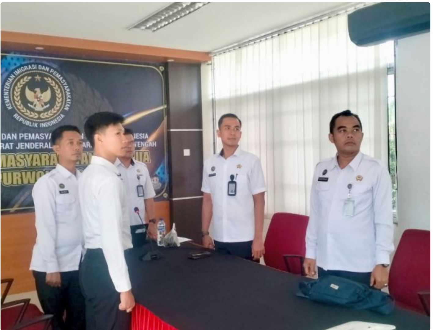
Rapat Koordinasi Pengendalian Capaian Kinerja Semester II dan Refleksi Akhir Tahun 2025

Purwokerto — Lembaga Pemasyarakatan Kelas IIA Purwokerto mengikuti Rapat Koordinasi Pengendalian Capaian Kinerja Semester II dan Refleksi Akhir Tahun 2025 secara daring pada Senin, 15 Desember 2025 pukul 09.00 hingga pukul 11.00. dan diikuti oleh Kepala Lapas, pejabat struktural, serta seluruh jajaran