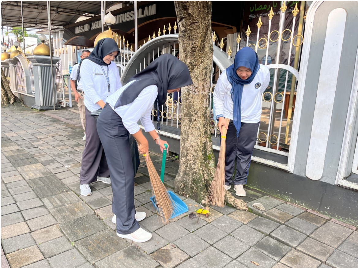
Dengan bekal peralatan kebersihan lengkap, para Petugas Lapas Narkotika Purwokerto bahu-membahu membersihkan sampah, memangkas rumput liar, dan merapikan area publik agar lebih nyaman digunakan oleh masyarakat luas.