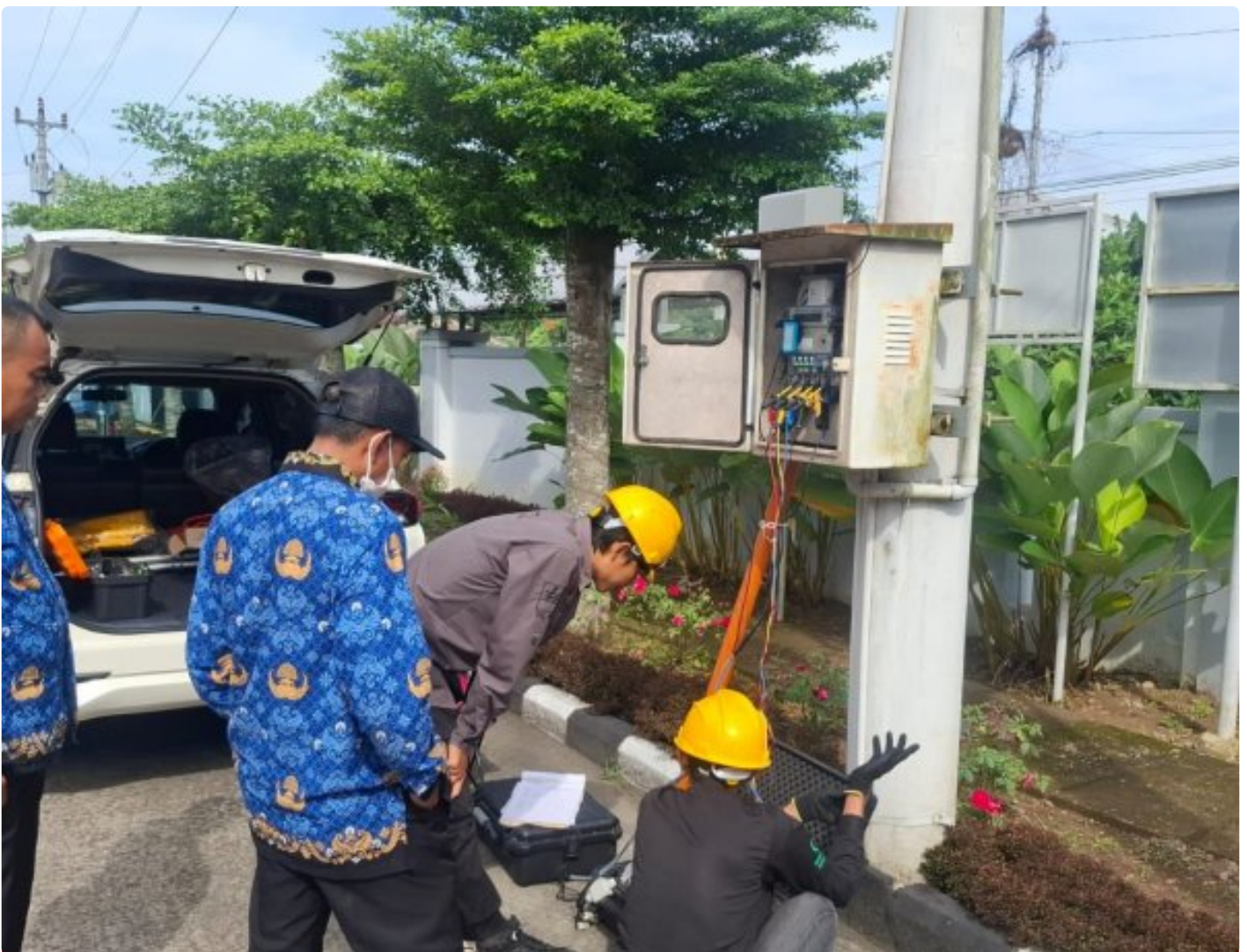
Pastikan Keamanan Penggunaan Energi Listrik, PLN UP3 Purwokerto laksanakan Validasi APP Rutin di Lapas Purwokerto

PURWOKERTO - PLN melalui UP3 Purwokerto melaksanakan kegiatan validasi APP (Alat Pengukur dan Pembatas) di Lapas Kelas IIA Purwokerto sebagai bagian dari pengawasan dan pengendalian keandalan sistem kelistrikan, pada