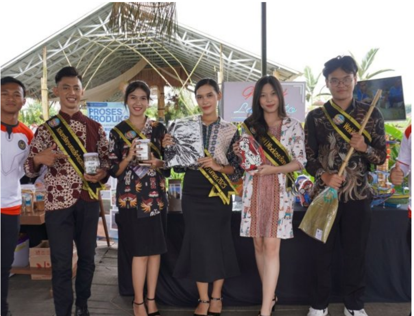
Pameran Karya WBP Purwokerto jadi Sorotan Publik dalam Event dari Jeruji Besi Menjadi Inspirasi

PURWOKERTO - Kegiatan pameran seni dan hasil karya Warga Binaan Pemasyarakatan (WBP) Lapas Kelas IIA Purwokerto kembali menarik perhatian masyarakat. Melalui event bertajuk “Dari Jeruji Besi Menjadi Inspirasi, Mengikis Stigma Merajut Asa”, berbagai karya kreatif WBP ditampilkan sebagai bagian dari