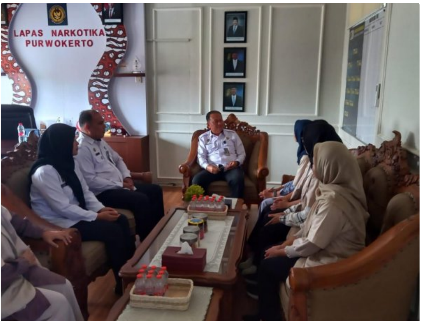
Mahasiswa Profesi Dietisien Poltekkes Kemenkes Semarang Gelar PKP di Lapas: Tingkatkan Edukasi Gizi bagi Warga Binaan

Purwokerto – 5 orang Mahasiswa Program Studi Pendidikan Profesi Dietisien Poltekkes Kemenkes Semarang melaksanakan kegiatan Praktik Kerja Profesi (PKP) di Lembaga Pemasyarakatan (Lapas) Narkotika Kelas IIB Purwokerto