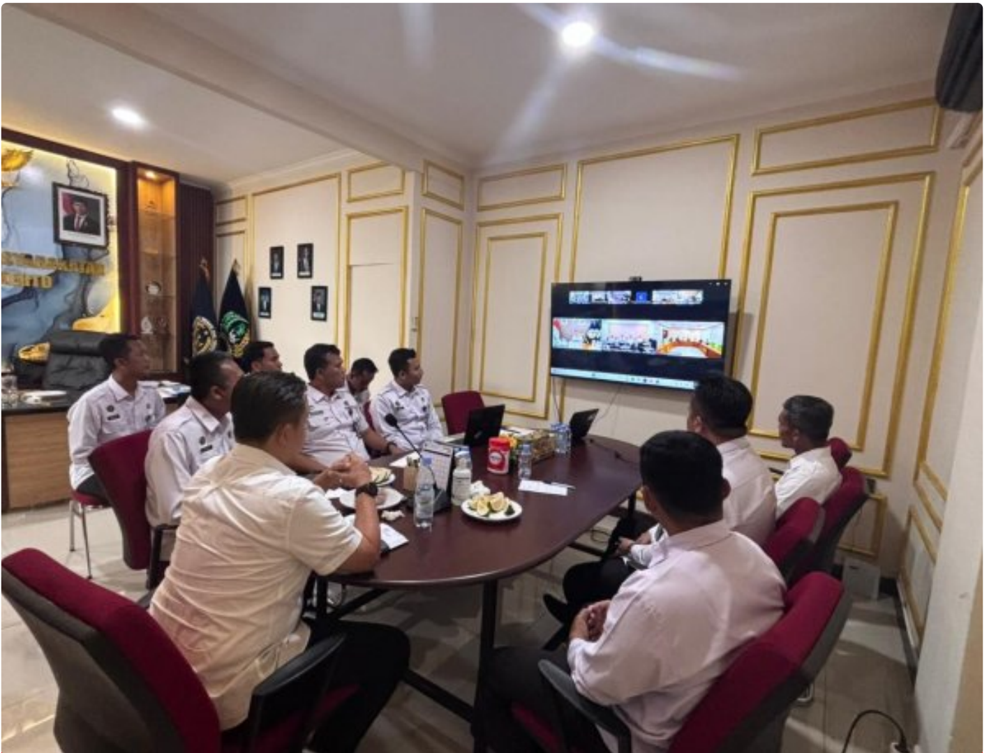
Lapas Purwokerto ikuti Zoom Meeting Arahan Menteri Imipas terkait Pengadaan Bahan Makanan TA 2026

PURWOKERTO - Lapas Kelas IIA Purwokerto mengikuti Zoom Meeting Arahan Menteri Imigrasi dan Pemasyarakatan mengenai persiapan pengadaan bahan makanan Tahun Anggaran 2026 pada Kamis, 4 Desember 2025.