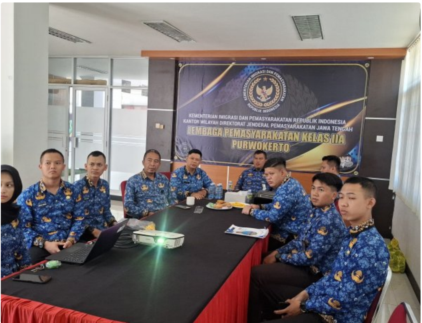
Lapas Purwokerto ikuti Zoom Meeting arahan, Evaluasi, dan Pembinaan Pelaksanaan Pengadaan BAMA melalui E-Purchasing TA 2026 serta Persiapan Nataru