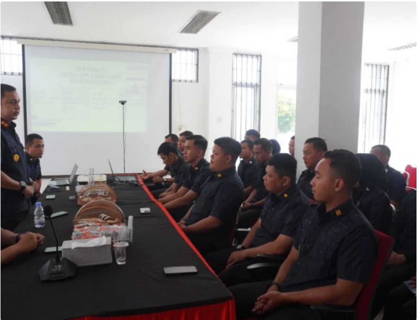
Lapas Purwokerto Ikuti Pendampingan Persiapan Desk Evaluasi Zona Integritas

Purwokerto — Lembaga Pemasyarakatan Kelas IIA Purwokerto mengikuti kegiatan pendampingan persiapan desk evaluasi pembangunan Zona Integritas yang diselenggarakan oleh Kantor Wilayah Direktorat Jenderal Pemasyarakatan Jawa Tengah, Kamis (30/4/2026).