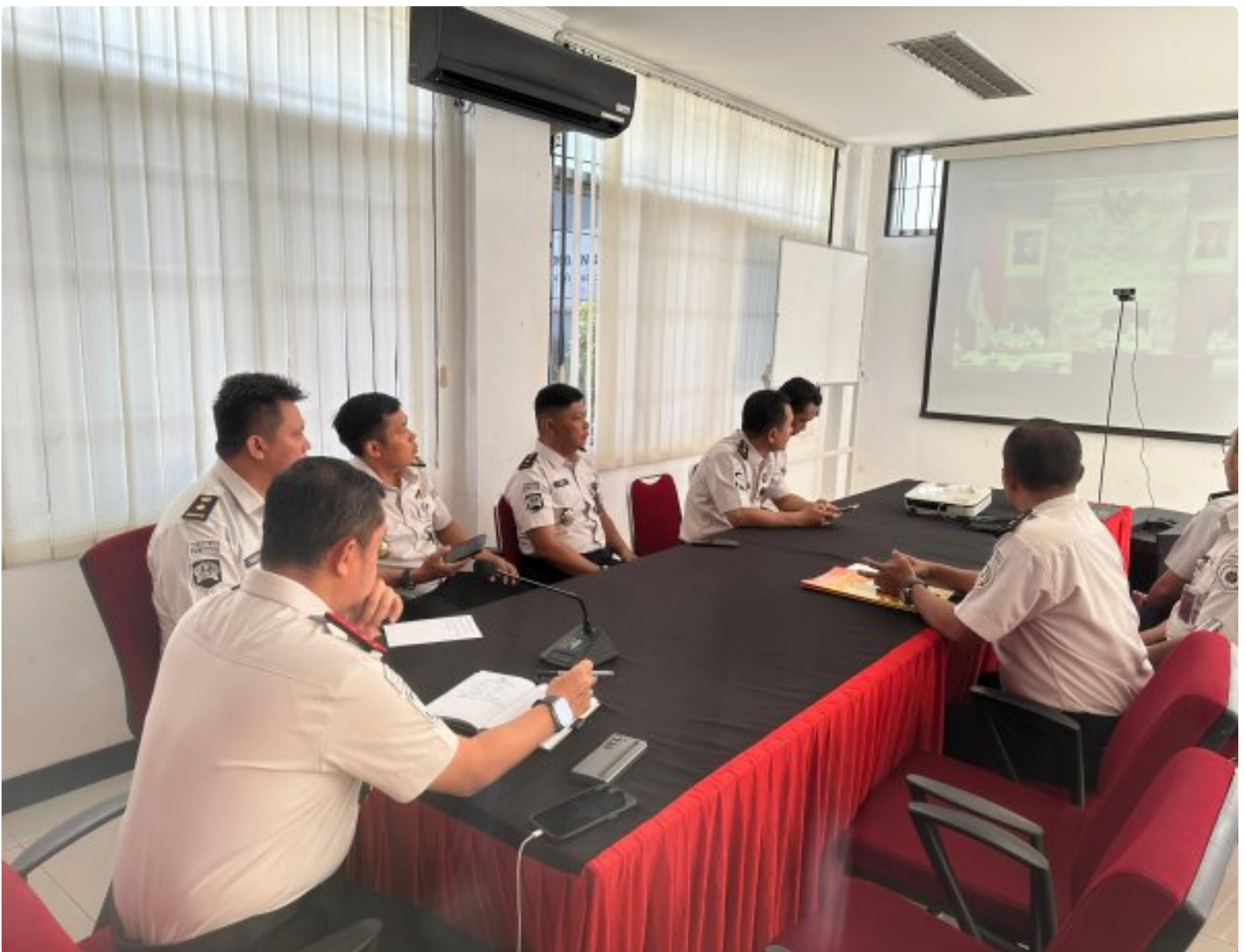
Lapas Purwokerto Ikuti Arahan Ditjenpas, Matangkan Kesiapan Layanan Kunjungan Idul Fitri 1447 H

PURWOKERTO - Lembaga Pemasyarakatan Kelas IIA Purwokerto mengikuti arahan Direktur Jenderal Pemasyarakatan terkait kesiapan layanan kunjungan Hari Raya Idul Fitri 1447 H yang dilaksanakan secara virtual pada Selasa, 17 Maret 2026.