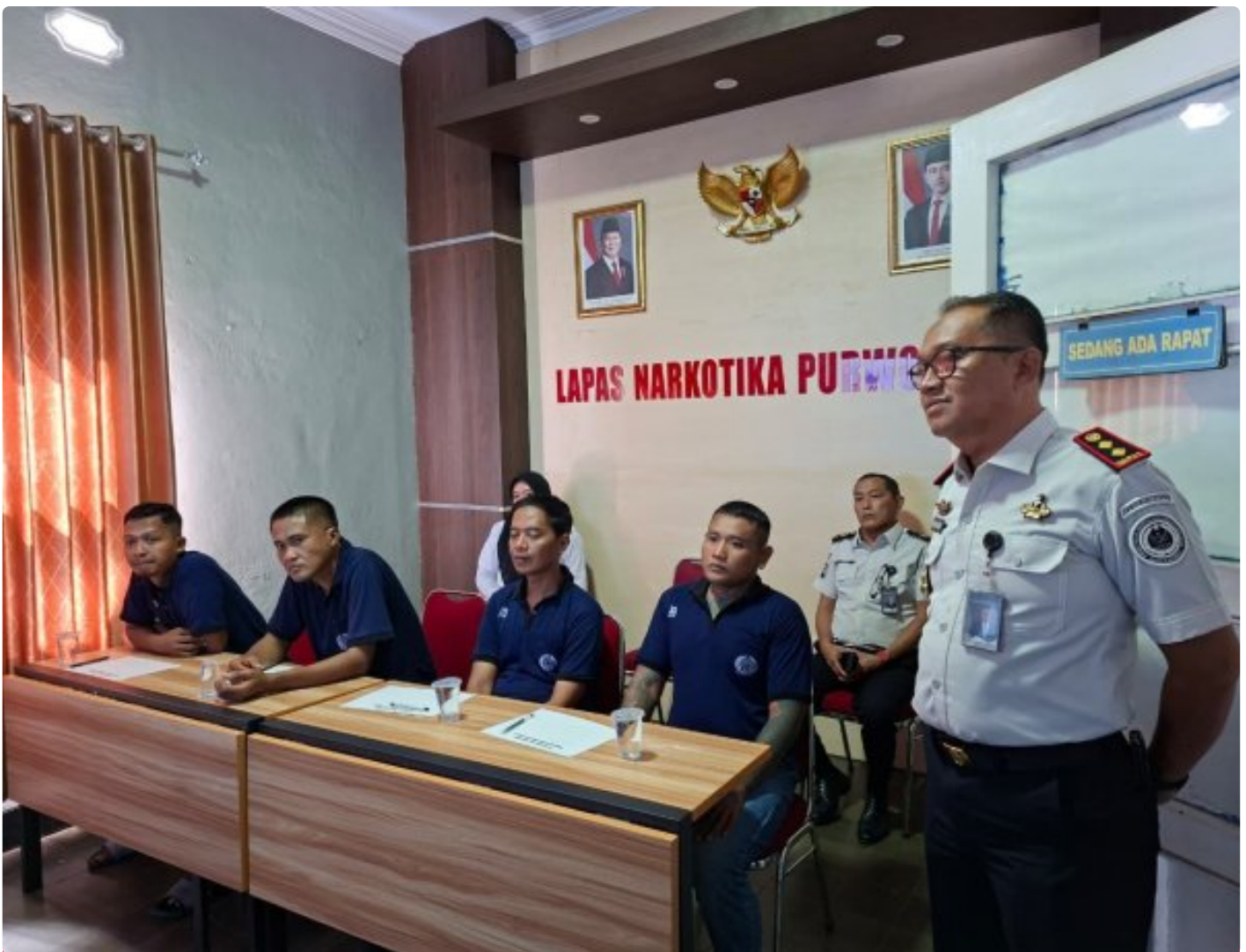
Lapas Narkotika Purwokerto siapkan Warga Binaan Menuju Reintegrasi Sosial Melalui Program Release Talk

Purwokerto – Lembaga Pemasyarakatan (Lapas) Narkotika Kelas IIB Purwokerto terus menunjukkan komitmennya dalam melaksanakan pembinaan kepribadian bagi warga binaan.