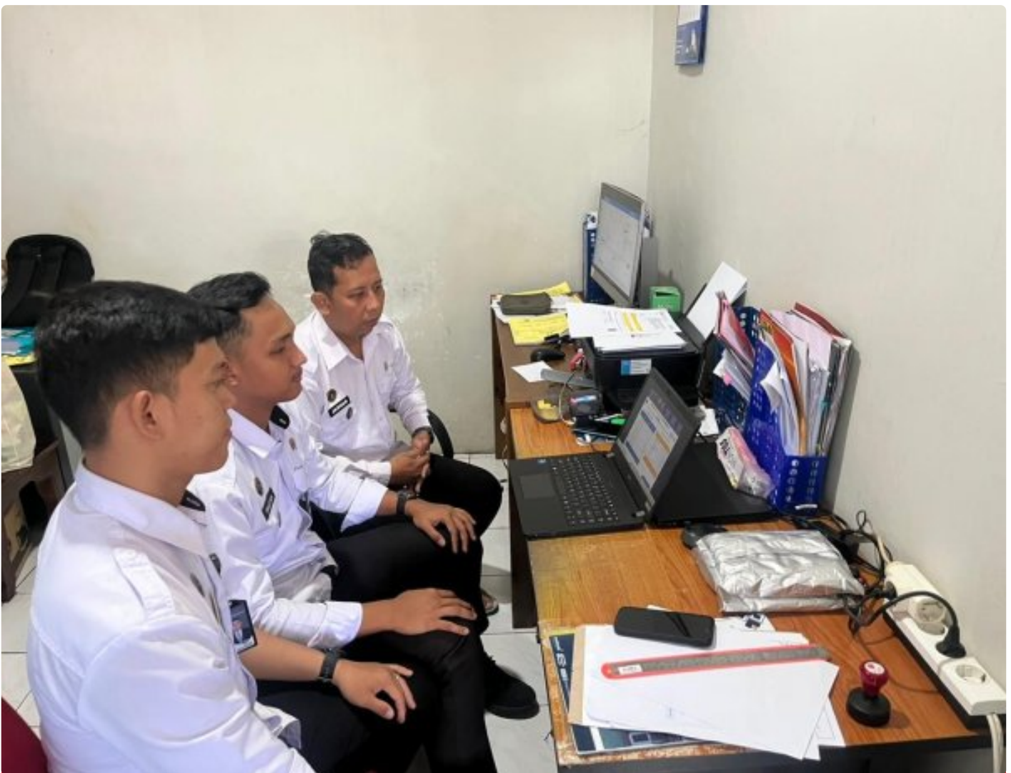
Lapas Narkotika Purwokerto Raih Apresiasi Tinggi dalam KPPN Purwokerto Awards TA 2025

Purwokerto – Lembaga Pemasyarakatan Narkotika (Lapas) Kelas IIB Purwokerto, telah dilaksanakan kegiatan Rapat Koordinasi Evaluasi Kinerja Pelaksanaan Anggaran dan Kantor Pelayanan Perbendaharaan Negara (KPPN) Purwokerto Awards Tahun 2025 secara daring melalui platform Zoom Meeting di