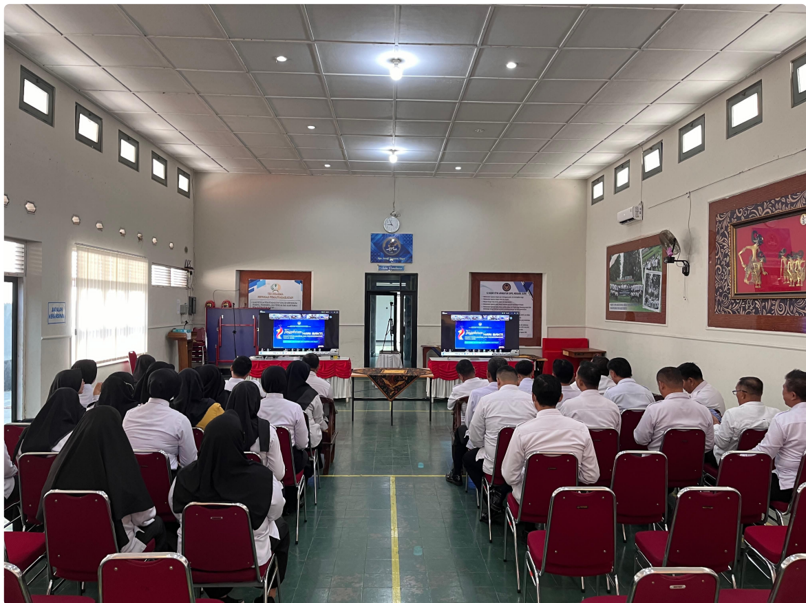
Kegiatan yang diisi dengan pemaparan capaian kinerja selama satu tahun ini dan