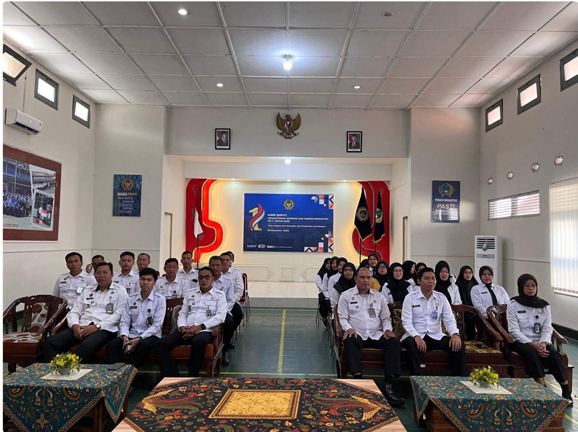
Kehadiran seluruh pegawai menjadi wujud komitmen Lapas Narkotika Purwokerto dalam mendukung program dan arahan Kemenimipnas.