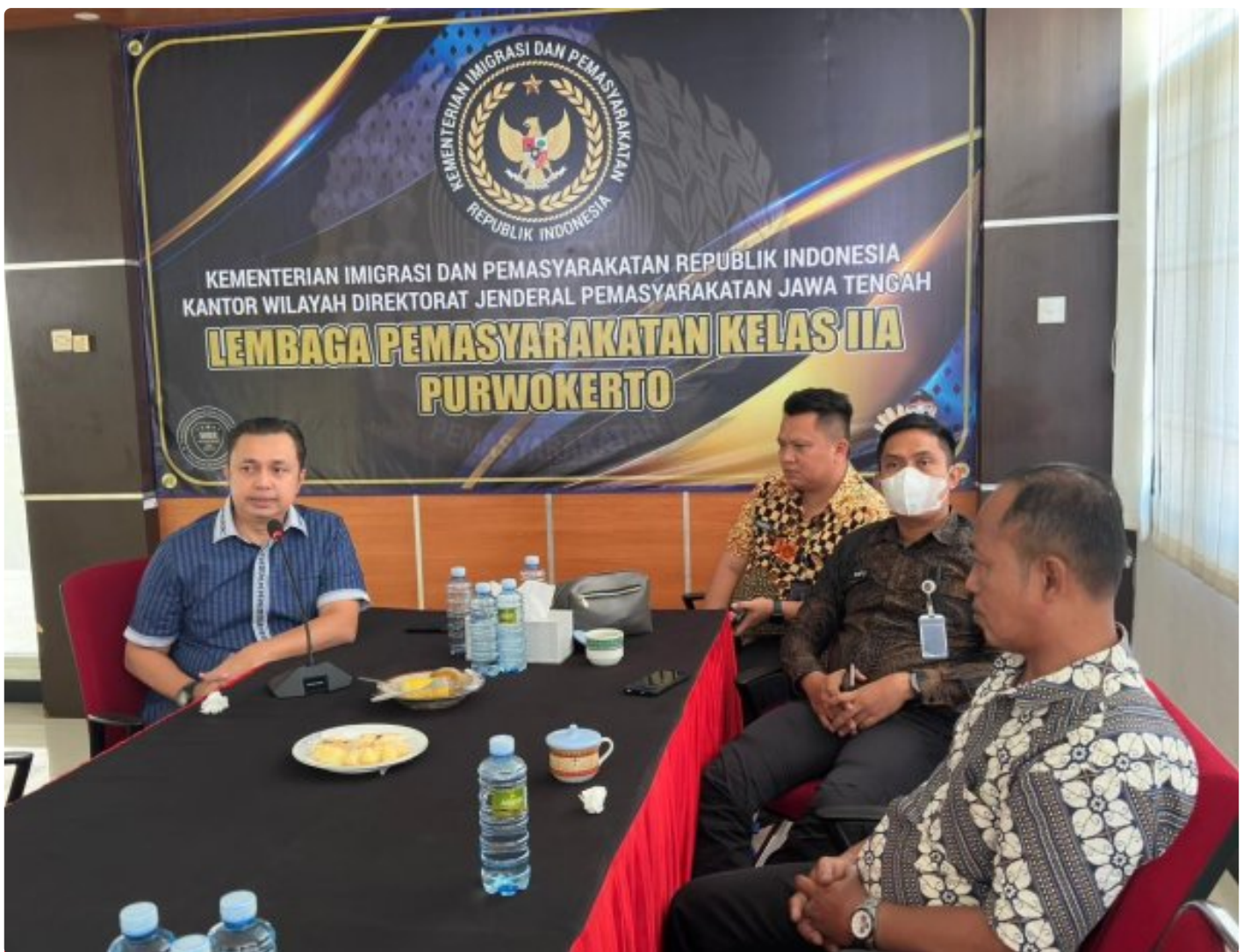
Lapas Kelas IIA Purwokerto Ikuti Zoom Meeting Penguatan Arahan Dirjen Pemasyarakatan

Purwokerto – Kepala Lembaga Pemasyarakatan (Kalapas) Kelas IIA Purwokerto beserta jajaran mengikuti kegiatan Zoom Meeting Penguatan dan Tindak Lanjut Arahan Direktur Jenderal Pemasyarakatan yang diselenggarakan oleh Kantor Wilayah Direktorat Jenderal Pemasyarakatan Jawa Tengah, Kamis (8/1/2026).