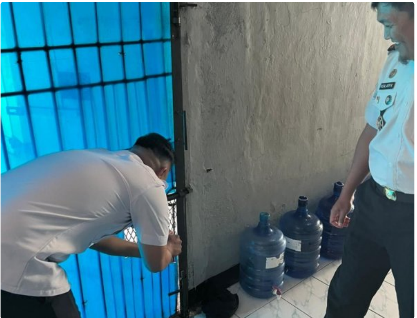
Cegah Gangguan Kamtib, Lapas Narkotika Purwokerto Laksanakan Pemeliharaan Sarana Keamanan

Purwokerto – Dalam rangka menjaga keamanan dan ketertiban (kamtib) di lingkungan Pemasyarakatan, Lembaga Pemasyarakatan (Lapas) Narkotika Kelas IIB Purwokerto melaksanakan kegiatan pemeliharaan sarana dan prasarana keamanan, salah satunya melalui pelumasan gembok, Selasa (6/1/2026).