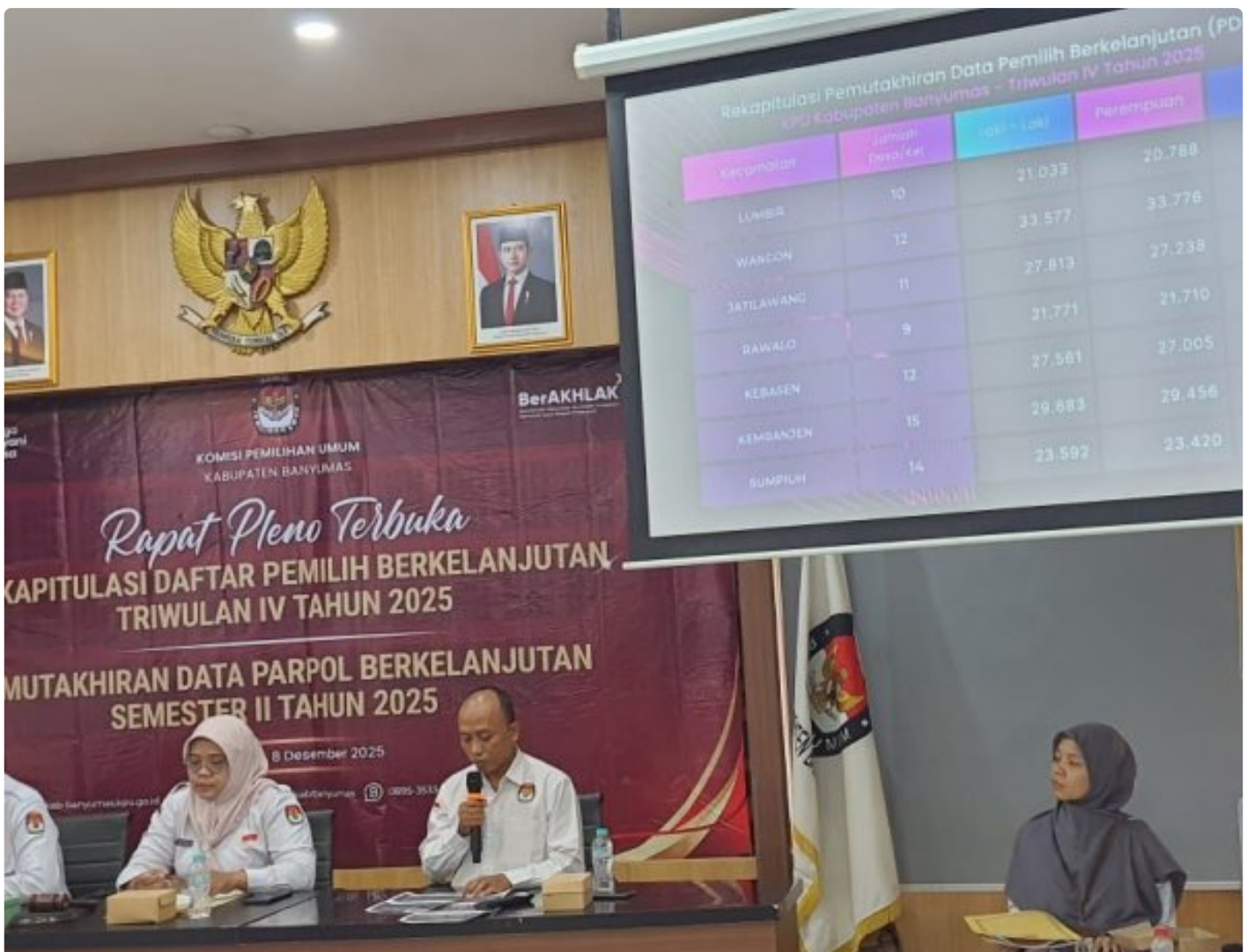
Bersama Awasi Data Pemilih, Lapas Purwokerto Hadiri Rapat Pleno Terbuka KPU Kabupaten Banyumas Tahun 2025

PURWOKERTO - Lembaga Pemasyarakatan Kelas IIA Purwokerto turut serta dalam Rapat Pleno Terbuka Rekapitulasi Daftar Pemilih Berkelanjutan (DPB) Triwulan IV serta Pemutakhiran Data Partai Politik Semester II Tahun 2025 yang